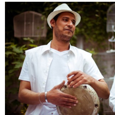
Hussein El Azab Musicien