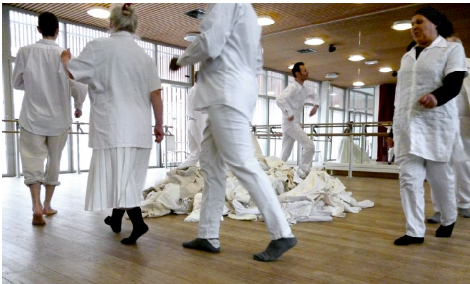
Au centre d'animation Marc Sangnier, ils expérimentent les costumes, l'habillage et la transformation à vue.