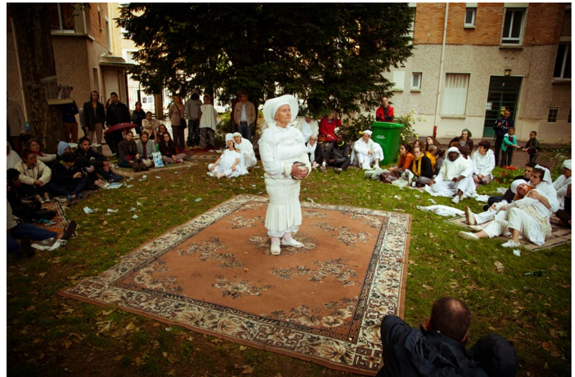
2-4 rue du Général Séré de Rivière - 23 juin 2013