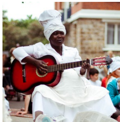
Kadi Diarra Comédienne / Chanteuse