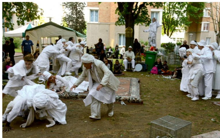
11 avenue Georges Lafenestre - 22 juin 2013