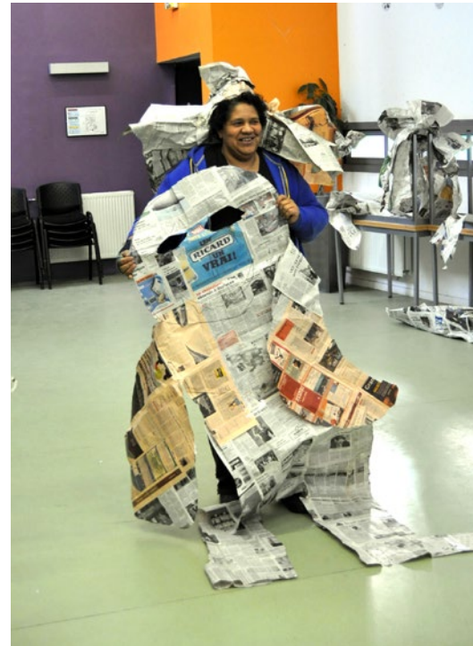
Au centre Maurice Noguès, les amateurs construisent des scènes sur la thématique des journaux et de la bonne nouvelle.