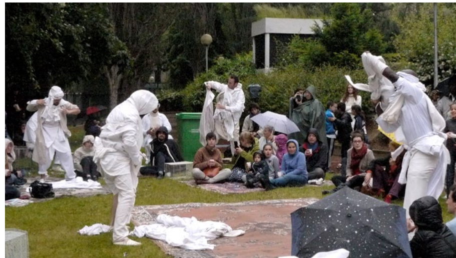
144 rue Raymond Losserand - 9 juin 2013