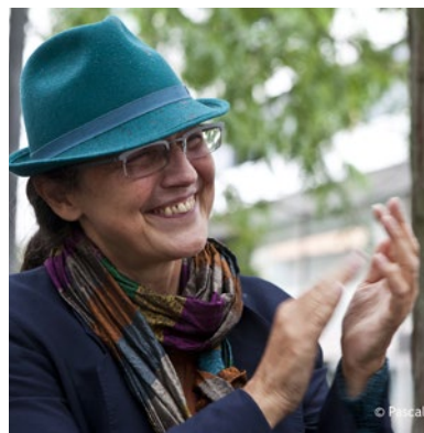
Marie-Do Fréval Auteur(E) / Metteur(E) en scène