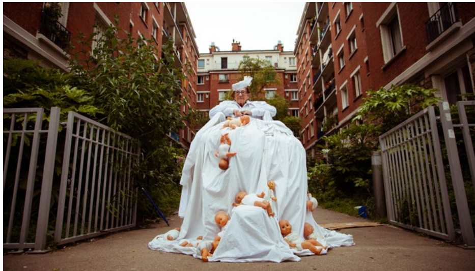
156 rue Raymond Losserand - 8 juin 2013

La compagnie adapte son espace de jeu à chacun des lieux qui l'accueillent.