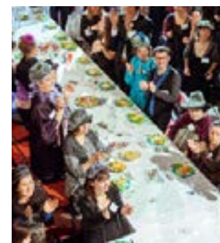
Le Banquet des familles Reconstitué(E)s