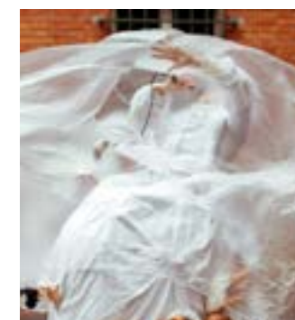
Les Tombé(E)s du camion

Le Banquet des familles reconstitué(E)s, c'est l'envie de réunir un public initié et néophyte dans un dispositif artistique déjanté. C'est une soirée délirante où se construit à vue l'imaginaire collectif d'une famille dans laquelle chacun existe et se reconnaît.