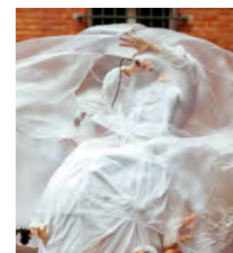
Les Tombé(E)s du camion

Le Banquet des familles reconstitué(E)s, c'est l'envie de réunir un public initié et néophyte dans un dispositif artistique déjanté. C'est une soirée délirante où se construit à vue l'imaginaire collectif d'une famille dans laquelle chacun existe et se reconnaît.